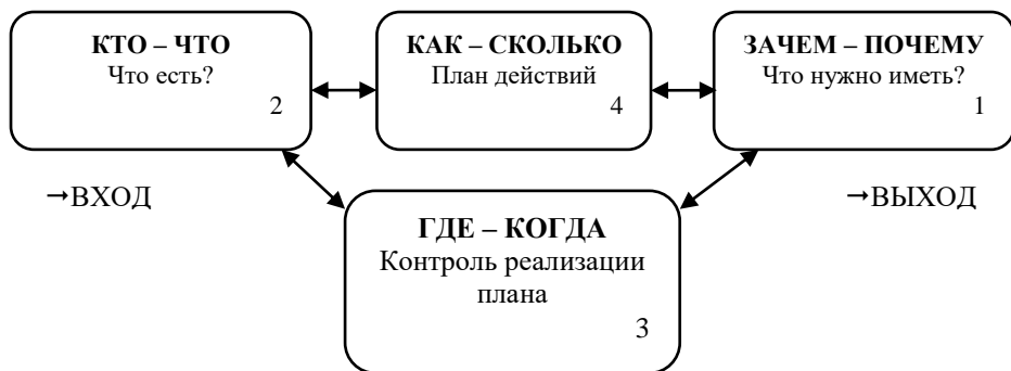
Рисунок 1 – Ключевые вопросы проектирования

✓ переход от принципа «разделяй и властвуй» к принципу «ОБЪЕДИНЯЙ и ЗДРАВСТВУЙ» 2 ;